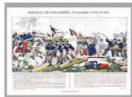
IMAGE La Bataille de Coulmiers 1870 : 10.00 € d'après PINOT Image d'Epinal Format 40x 30 cm

S'adresser au secrétariat de la Mairie de Coulmiers : mairie.coulmiers@orange.fr